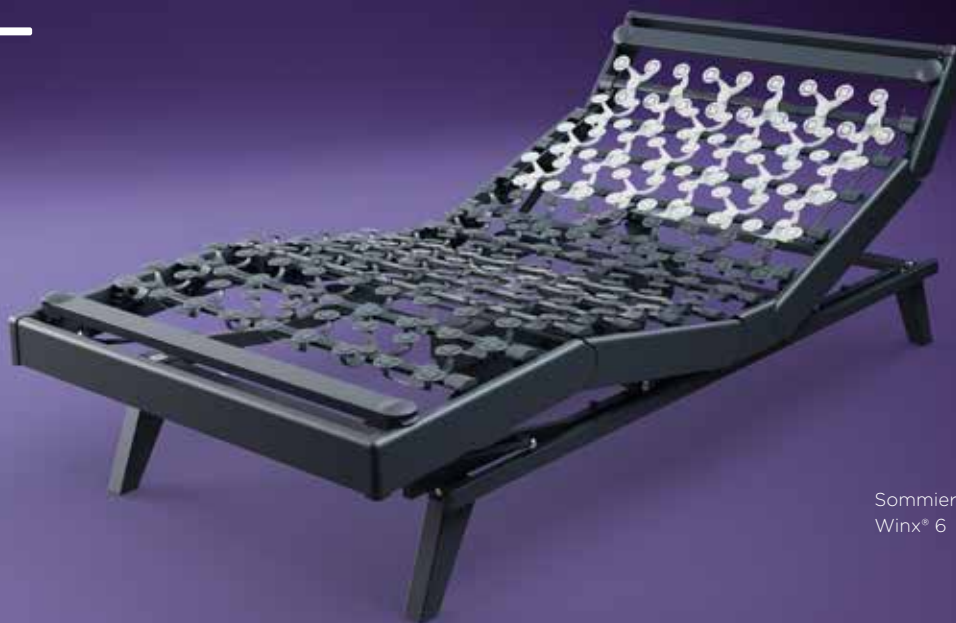
Sommier Winx® 6